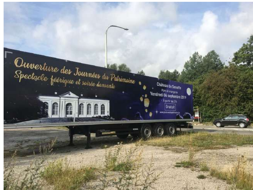
Remorque à Seneffe