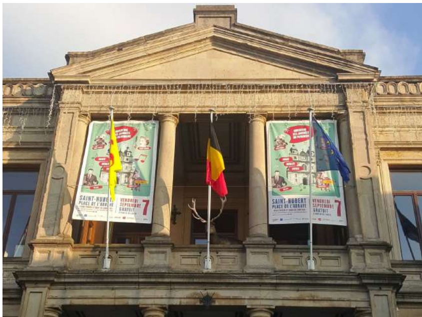
Bâches à Saint-Hubert