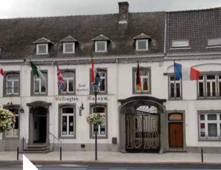
Musée Wellington