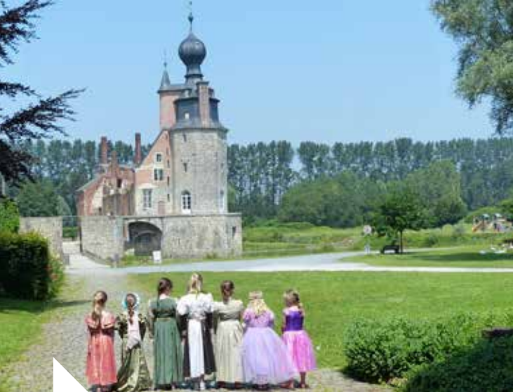
N. Darville © Les Amis du château des ducs d'Havré