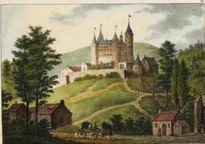
Château de Celles (province de Namur.)