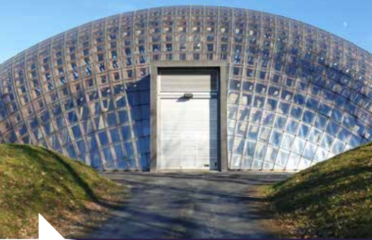
© Ph. Samyn et associés, architectes et ingénieurs