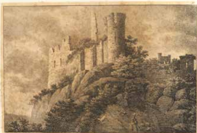
Ruines de Montaigne province de Namur