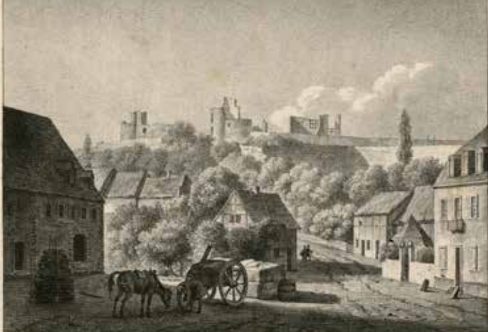
Chateau de Rochefort.