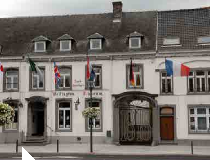
J.-M. Lenglez © Musée Wellington