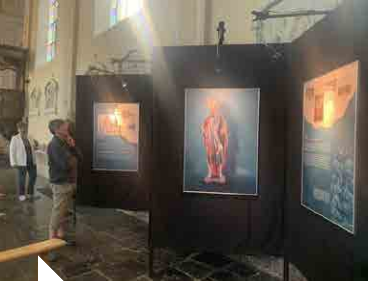
B. Patris © Province de Namur