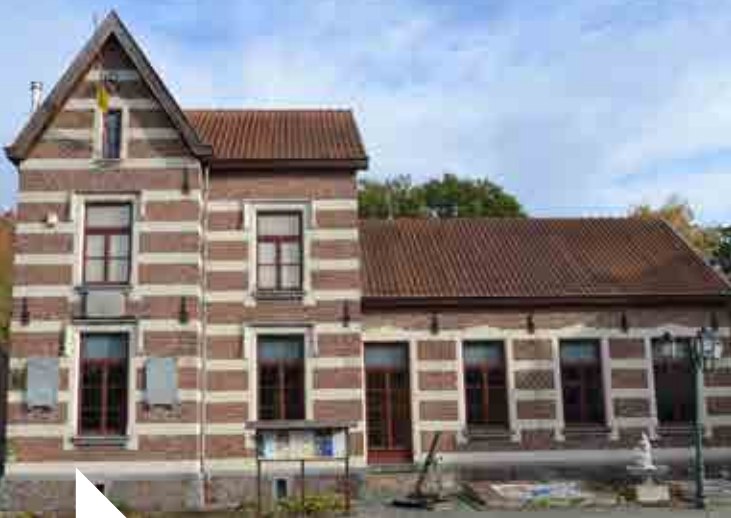
L. Remacle © Musée Armand Pellegrin