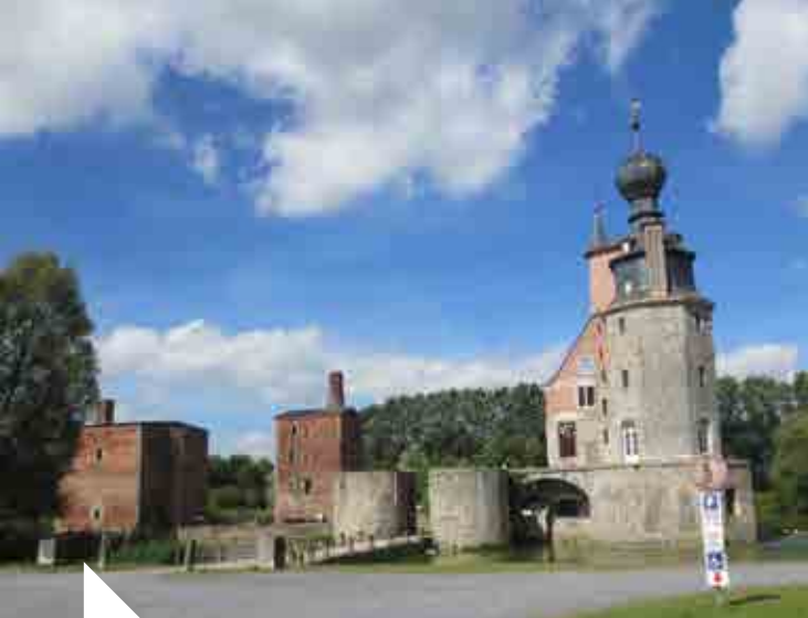
N. Darville © Les Amis du château des ducs d'Havré