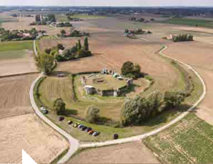
O. Moulin © Château de la Royère