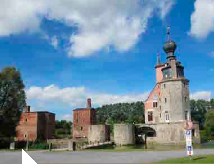
N. Darville © Les Amis du château des ducs d'Havré