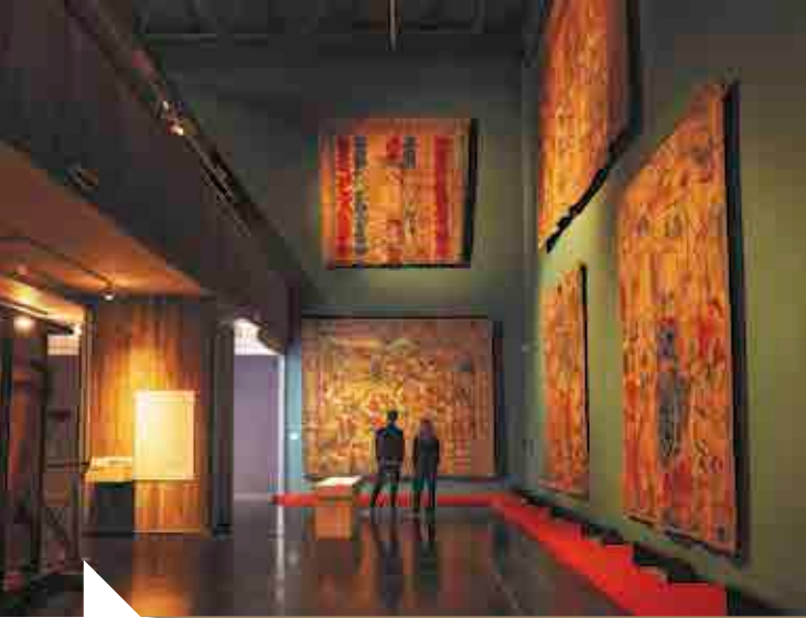
J. Ransy, Jardin enchanté