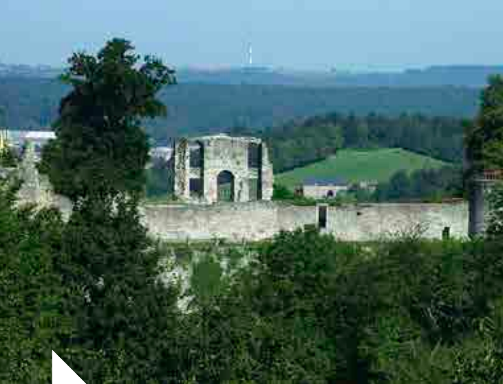
C. Limbrée © Château comtal de Rochefort