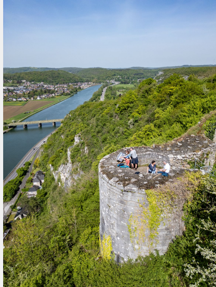
Site de Poilvache, Dinant.