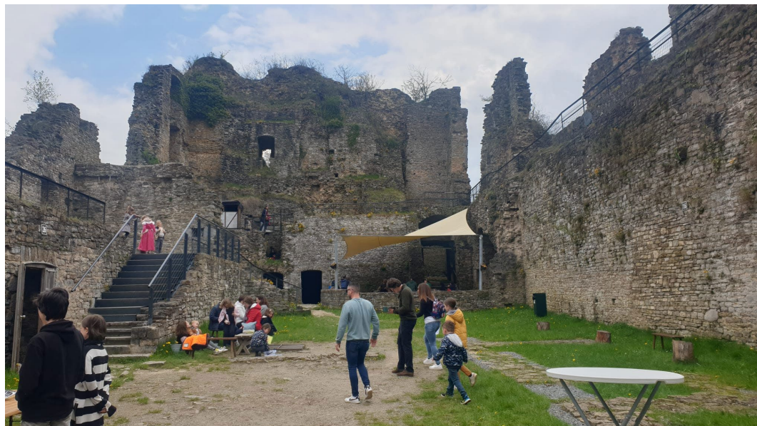
Château de Franchimont.