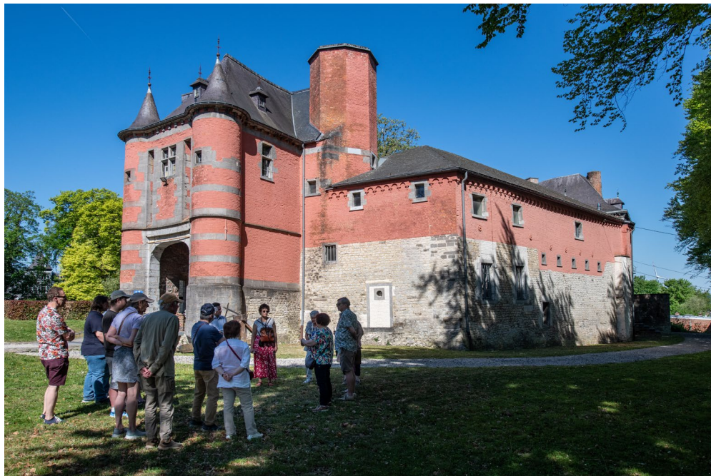
Château de Trazegnies.