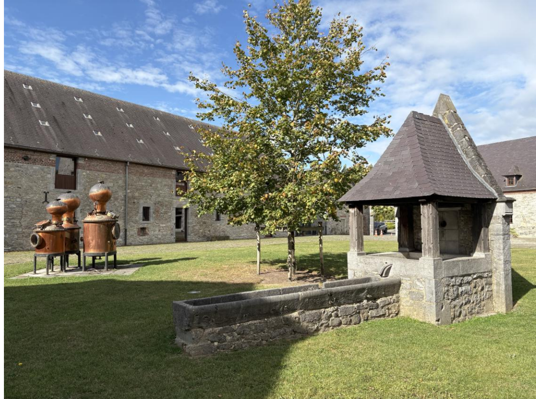
Distillerie de Biercée, Thuin.